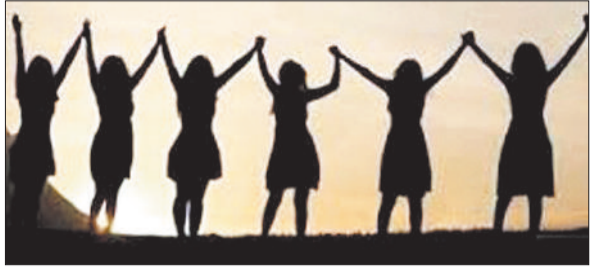
हरिभूमि न्यूज, बैकुण्ठपुर।

अंतर्राष्ट्रीय महिला दिवस के अवसर पर 8 मार्च को महिलाओं के सम्मान में जगह-जगह कार्यक्रम आयोजित किए जाएंगे। आज के बदलते दौर में महिलाएं केवल चारदीवारी तक सीमित नहीं हैं बल्कि खेती-किसाना