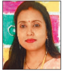
अपनी सफलता दर्ज करा रही है।