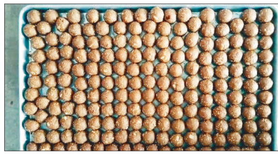
बनाए गए लड्डू

कर रही हैं। अलग-अलग धर्म, जाति और समुदाय से आने वाली महिलाएं जब एक साथ बैठकर इन पौष्टिक लड्डूओं का निर्माण करती हैं,