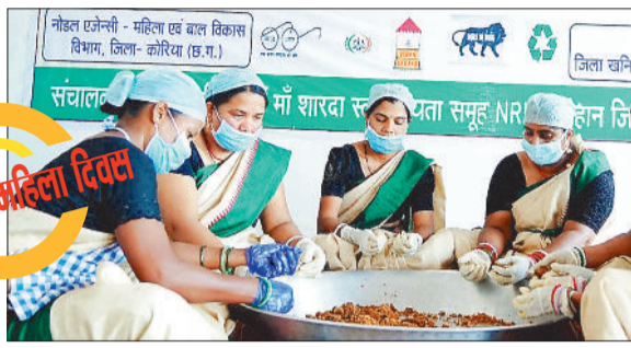
लड्डू निर्माण में जुटी महिलाएं।

बैकुंठपुर। जिले से महिला शक्ति, सामाजिक एकता और मातृ-शिशु स्वास्थ्य सुधार की एक प्रेरणादायक कहानी सामने आई है। बैकुंठपुर विकासखंड के ग्राम आनी में ज्योति महिला स्व-सहायता समूह और मां शारदा स्व-सहायता समूह की महिलाएं कोरिया मोदक नामक पौष्टिक लड्डू तैयार कर रही हैं, जिन्हें गर्भवती महिलाओं को नियमित रूप से उपलब्ध कराया जा रहा है। इस अभिनव पहल से जिले में कम वजन वाले शिशुओं के जन्म की समस्या को कम करने में